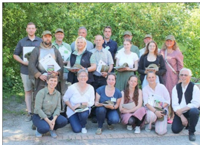
15 neue Natur- und Landschaftsführer erhielten ihre Auszeichnungen und sind nun als Botschafter für den Naturpark unterwegs.