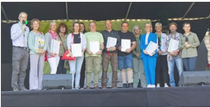
9 Betriebe und Institutionen erhielten ihre Auszeichnung als Naturpark-Partner im Rahmen des 122. Deutschen Wandertages in Heilbad Heiligenstadt.