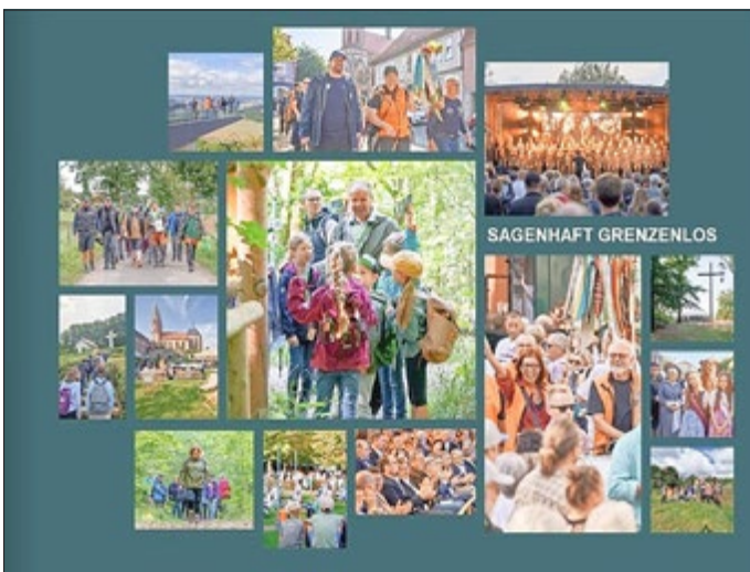
Der Bildband ist nicht käuflich erhältlich, aber kann in der Touristinfo und beim HVE angeschaut werden.