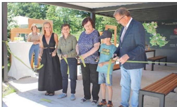
Mit Geldern des Thüringer Umweltministeriums konnte das Grüne Klassenzimmer zum Naturparkfest eröffnet werden. Mit frischer Luft und Blick ins Grüne werden hier nun Natur- und Umweltthemen vermittelt.