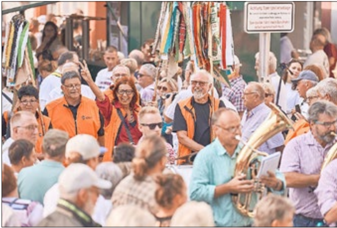
Der große Festumzug zieht am 22.09.2024 durch die Heiligenstädter Innenstadt.