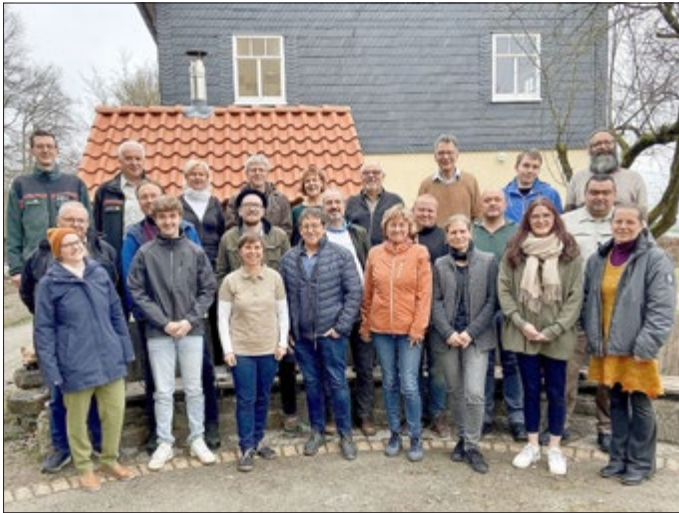
Der Runde Tisch Naturschutz bietet fachliche Vorträge und Austausch für alle Akteure im Naturschutz, der Forstwirtschaft, der Gewässerpflege und der Landwirtschaft.